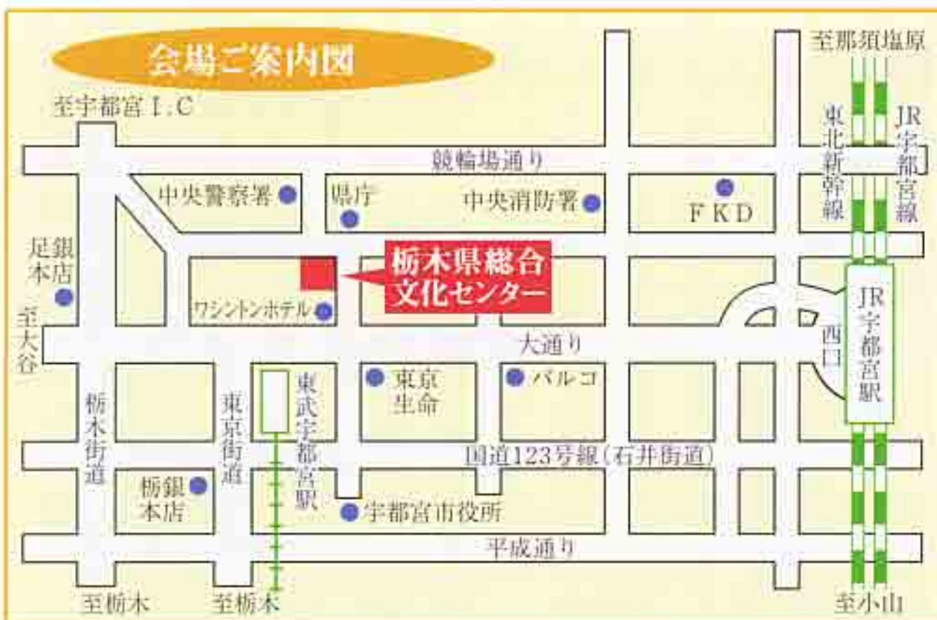
※会場には駐車場がありませんので、公共交通機関をご利用ください。