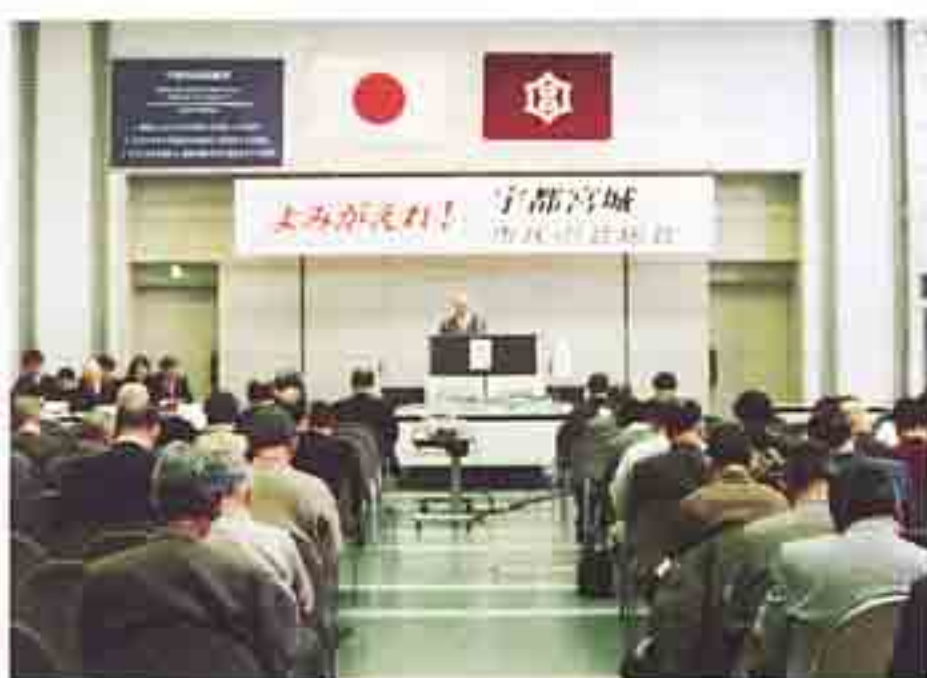
■平成15年3月29日(土) 第2回総会

結びに、会員のみなさまをはじめ、関係者の方々のご健勝をお祈り申し上げ、会報創刊にあたってのご挨拶とさせていただきます。