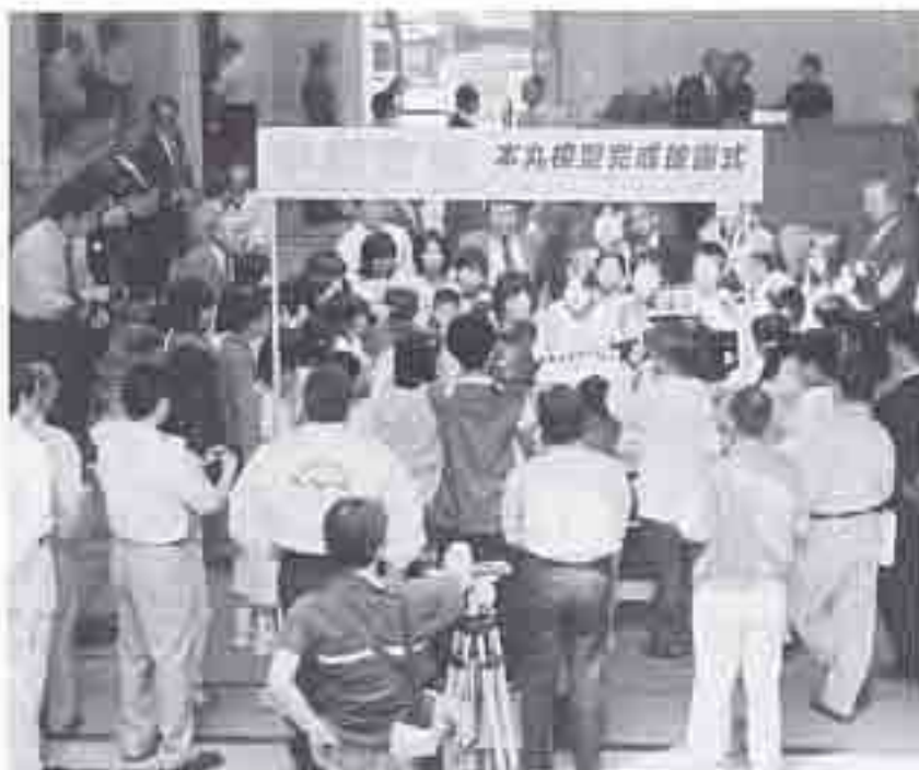
■平成15年5月6日（火） 模型完成披露式

※各地区、初日と最終日は搬入日となりますのでご注意ください。 ※平日は午前8時30分～午後9時30分、土・日・祝日は午前9時～午後9時30分までご覧になれます。 ※年末年始は休館となります。