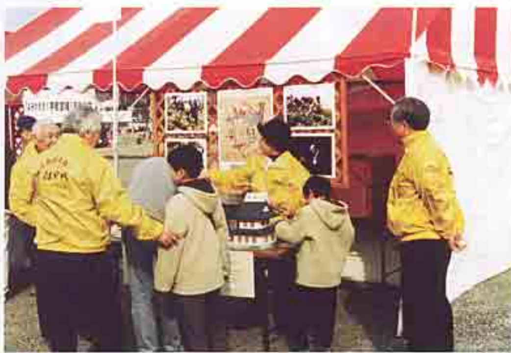
■イベントでのPR・募金活動

櫓や土塀の復元には約二万枚の瓦が使われるそうです。瓦募金にご協力いただいた方は、瓦の裏にお名前やメッセージを直筆で入れることができます。(復元工事の進捗に合わせて記名式を開催する予定です。) お子さん・お孫さんのご誕生や、ご結婚をはじめ様々な記念として、宇都宮城に思いを刻んでみませんか？そして何年か後に、あるいは何十年か後に、ぜひ復元された宇都宮城を訪れてください。当時の思いが、どこかの瓦の裏に必ず刻み込まれています。